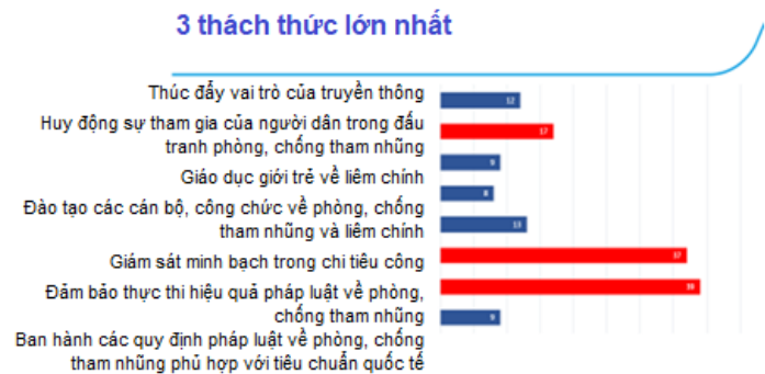
Thách thức trong đấu tranh phòng, chống tham nhũng theo quan điểm của các bên liên quan (Khảo sát trực tuyến)

Chiến lược này đưa ra một khung thay đổi nhằm giúp TT tạo ra được những đóng góp có giá trị vào công cuộc đấu tranh phòng, chống tham nhũng của Việt Nam trong 5 năm tới. Chiến lược này có tham khảo Khung chiến lược đến năm 2030 của Tổ chức Minh bạch Quốc tế 10 , nghiên cứu bối cảnh của Việt Nam trong đấu tranh phòng, chống tham nhũng cũng như những thành công và bài học kinh nghiệm mà TT thu được trong giai đoạn vừa qua.