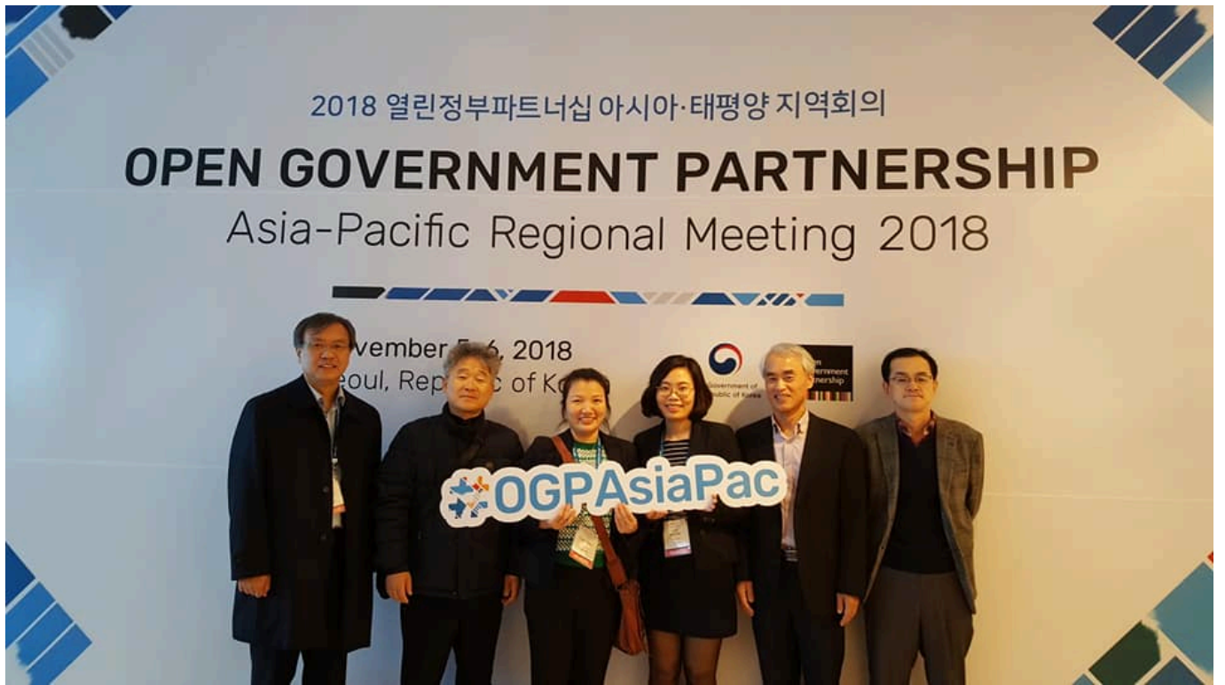
Cán bộ Tổ chức Hướng tới Minh bạch giao lưu và chụp ảnh lưu niệm với các cán bộ tổ chức Minh bạch Quốc tế Hàn Quốc