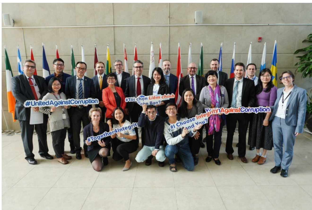
Các cựu học viên VIS tại lễ khởi động dự án LIFT Việt Nam

Để tạo điều kiện và thúc đẩy hơn nữa vai trò của thanh niên trong việc xây dựng văn hoá liêm chính, TT cùng Liên minh Châu Âu (EU) hợp tác thực hiện dự án “Thống lĩnh trẻ liêm chính vì một Việt Nam minh bạch” (LIFT Việt Nam). Thông qua dự án này, các bạn thanh niên sẽ có thêm kiến thức về liêm chính, minh bạch cũng như hiểu biết về EU và các giá trị nền tảng của EU, trong đó có giá trị liêm chính.